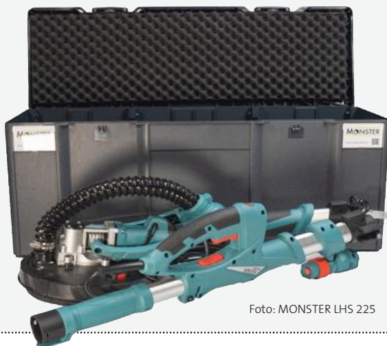
Foto: MONSTER LHS 225

Der Hersteller Monster bietet mit dem LHS 225 einen leistungsstarken Langhalssschleifer mit vielen Ausstattungsmerkmalen zum perfekten Schleifen von Wänden und Decken. Dank Direktantrieb erzielt der LHS 225 eine hohe Abtragleistung. Das abnehmbare Bürstensegment ermöglicht problemloses Arbeiten bis in jede Ecke. Die Arbeitsfläche kann mit dem integrierten LED-Licht optimal ausgeleuchtet werden. Somit erhält der Anwender stets eine Rückmeldung über den Arbeitsfortschritt. Zusätzlich verfügt der LHS 225 über eine Verlängerungsfunktion für bequemeres Arbeiten an Decken. Die Drehzahl kann stufenlos von 800 – 1.700 U/min. angepasst werden. Dank des einzigartigen Klappmechanismus kann der LHS 225 bequem im passenden Systemainer verstaut werden. Das spart Platz im Auto und sorgt für Ordnung. Darüber hinaus zählt der LHS 225 mit nur 3,2 kg zu den Leichtesten seiner Klasse. www.linz-service.de